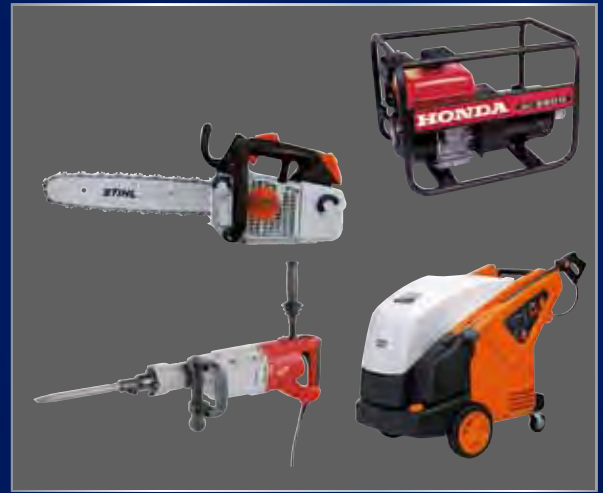
Een kleine greep uit ons verhuurprogramma

Om onze klanten zo goed mogelijk van dienst te kunnen zijn hebben wij een machineverhuur afdeling. Wanneer u uw machine of aanhangwagen voor reparatie en/of onderhoud brengt en hij is onmisbaar kunt u hiervan gebruik maken. Daarnaast hebben wij diverse machines in de verhuur die je als bedrijf (nog) niet zo snel aanschaft. Denk hierbij aan een pannenlift, rolsteiger, zware trilplaat, aanhangwagen e.d. Voor het actuele verhuuraanbod kunt u terecht op onze website.