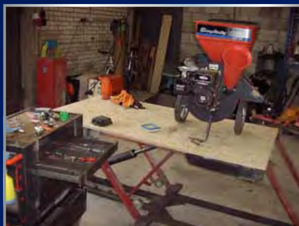
Eerste werkplaats 06-11-2006