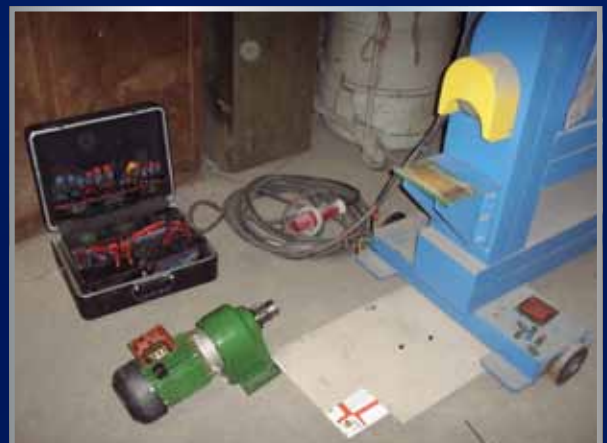
Reparatie van vertragingskast op elektromotor