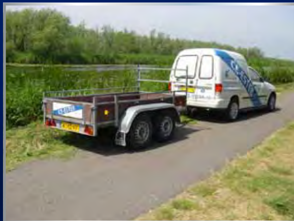
Eerste bedrijfswagen 01-05-2005

De mogelijkheden en oplossingen die we nu aan onze klanten aan bieden is in deze bedrijfsfolder uitgebreid te lezen en te zien.