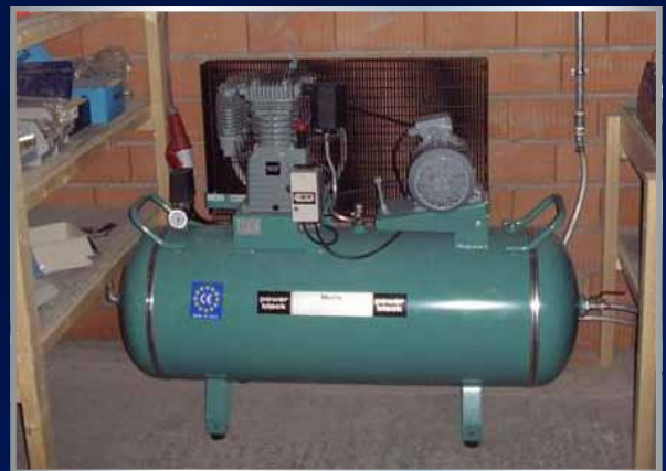
Nieuw geleverde en geïnstalleerde compressor

Door onze uitgebreide vakkennis kunnen wij u adviseren in de aanschaf van nieuwe en/of gebruikte machines in de metaal- en houtverwerkende industrie. Met het gebruikte aanbod aan conventionele machines die wij op voorraad hebben staan hebben wij al vele klanten aan een jong gebruikte en/of nieuwe machine geholpen.