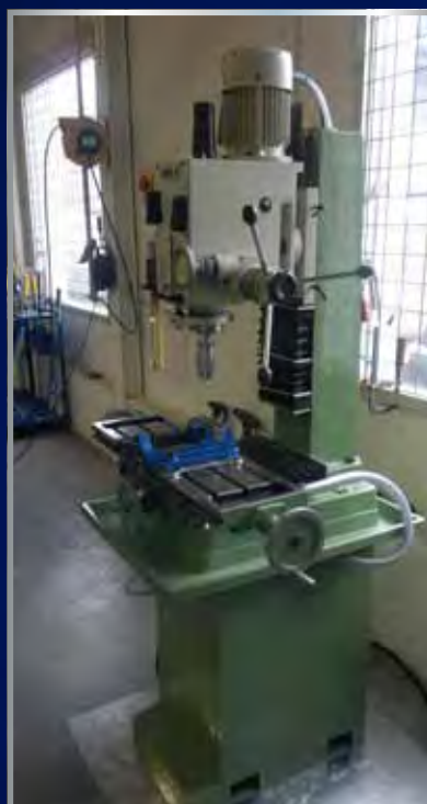
Nieuw geleverde boor/freesmachine