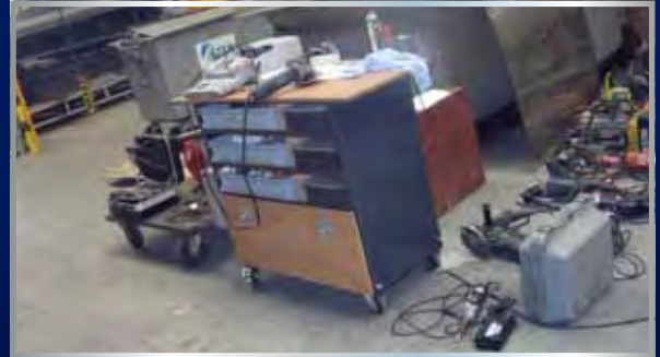
Keuren NEN 3140 elektrisch gereedschap