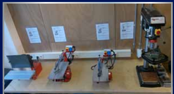
Aanpassen en Inrichten van werkplek op technische school