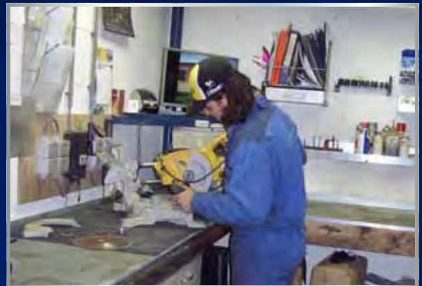
Reparatie van elektrisch en motorisch handgereedschap