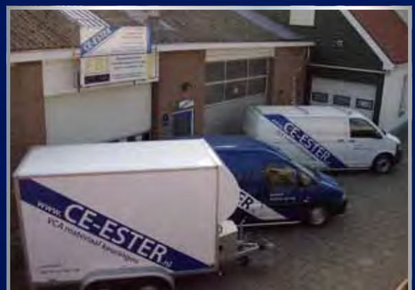
Keuringsaanhangwagen met verwarmde en verlichte werkplek en magazijn