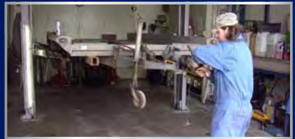
Keuren van aanhangwagens

Na de keuring van uw gereedschap en materialen krijgt u de certificaten digitaal aangeleverd in een inspectieverslag. Bij het naderen van de herkeuringsdatum krijgt u een herinnering toegezonden waarop er weer een afspraak gemaakt kan worden. Zodoende hebben u en wij de maximale grip op de status van uw machines en materiaal.