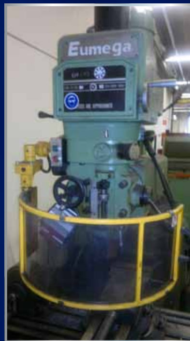
Montage van CE beschermkappen