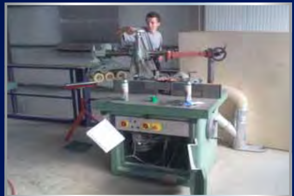
Keuren en onderhoud aan 400 V werkplaatsmachines