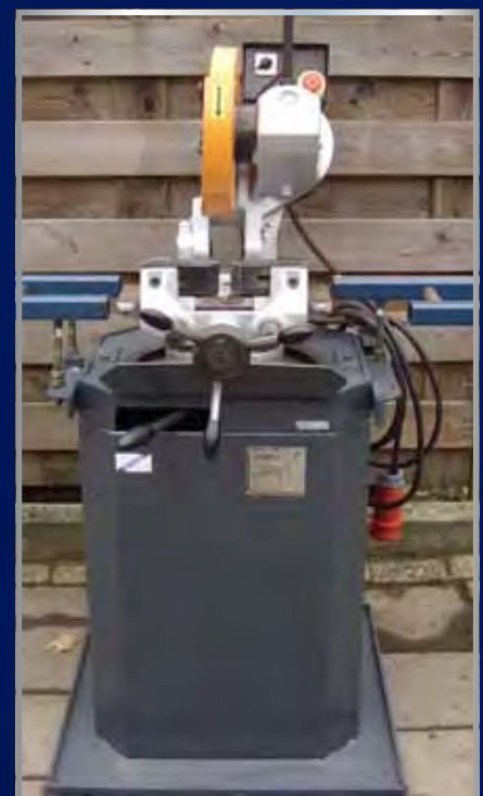
Gebruikte afkortzaag voor metaal