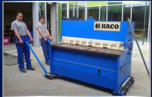
Verhuizen en installeren van HACO plaatschaar